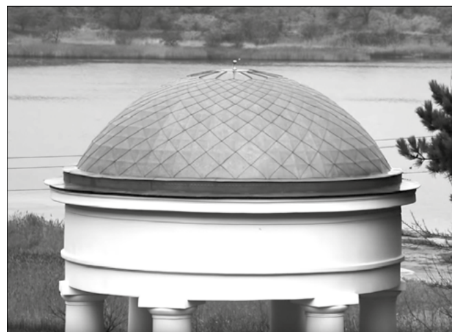
Беседка-ротонда с видом на лиман