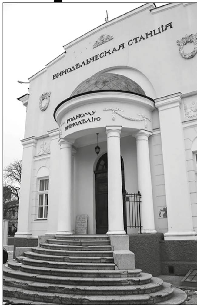
Главное здание Винодельческой станции

За 2 года построили целый комплекс зданий и сооружений: главный корпус Винодельческой станции, конюшне-экипажный сарай, микроподвал и казарму для рабочих. Но станцию нужно было оснастить оборудованием, поэтому ее официаль-