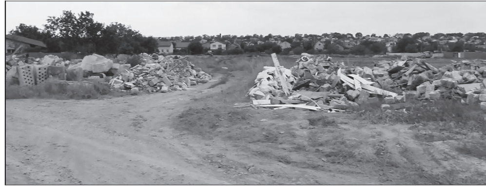
Сухой Лиман: вместо обещанных дорог – груды строительного мусора

Жаль, что качество жизни улучшается только у нашей власти, но отнюдь не у рядовых членов громады. В любом случае КПД (коэффициент полезного действия) нынешней власти измерят сами люди, пришедшие на осенние выборы, и почему-то я очень уверен, что эта оцен-