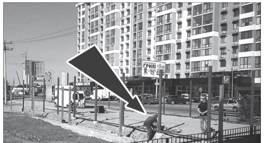
Строительство торговых павильонов в Червоном Хуторе и Совиньоне идет полным ходом

«кто хозяин?» мы, конечно же, не услышим знакомые нам депутатские фамилии – ну, не так же, в конце концов, они глупы. Жадные – да. Без-