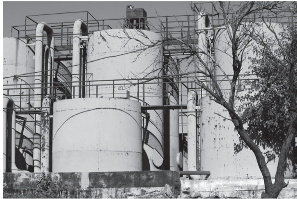
Таировские очистные – не предмет пиара, а серьезная проблема, требующая грамотного и комплексного подхода

А давайте вместе разберемся. Ведь не зря же столько времени сия ноша была неподъемной. А тут – бац! – потратили незначительные бюджетные средства (сколько – доподлинно неизвестно по причине нераспространения информации) и проблема исчезла. А все дело в привычке нашей «временной власти» пускать пыль в глаза и вешать обильно лапшу на уши. Нет никакого решения