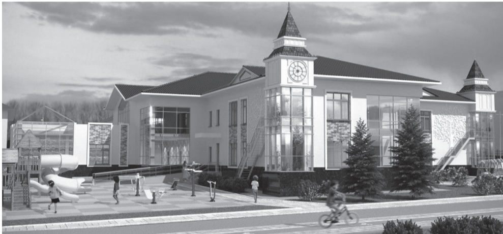
Проект детского сада в Таирово, «похудевшего» в два раза, так и остается только проектом

Можно предположить, что скоро проект строитель-