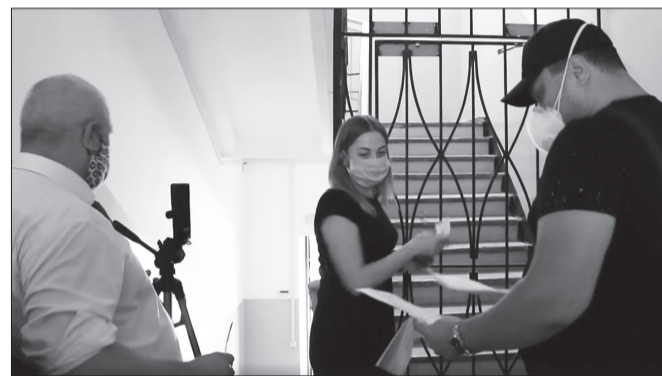
Власть оградилась от людей металлической решеткой

экологическому инспектору было отказано не только в проведении проверки, но даже в общении с руководством громады. Его просто