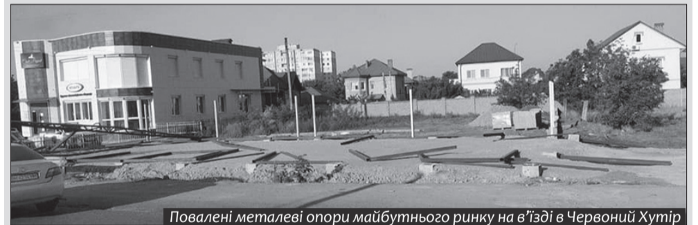
Повалені металеві опори майбутнього ринку на в'їзді в Червоний Хутір