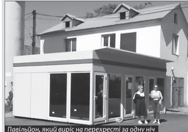
Павільйон, який виріс на перехресті за одну ніч