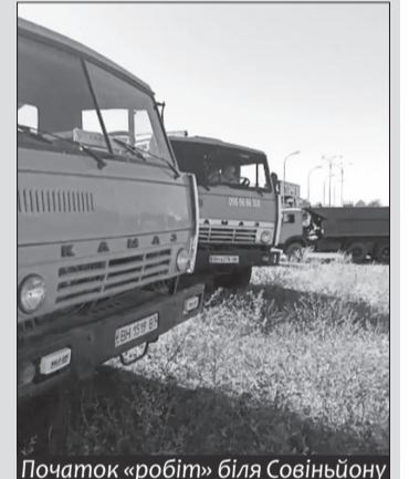
Початок «робіт» біля Совінйону