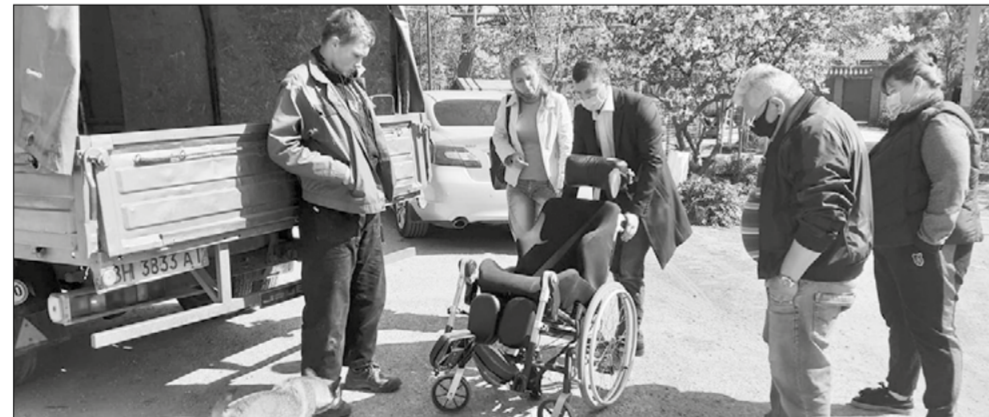
Представители ГО «Таїрове – це ми» привезли инвалидную коляску юному жителю Ульянівки

Безусловно, карантин наложил свой отпечаток на работу ГО, ограничив наши