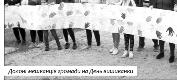
Долоні мешканців громади на День вишиванки

карантину людям похилого віку. Допомога! сплатити рахунки за комунальні послуги онлайн, купувати продукти