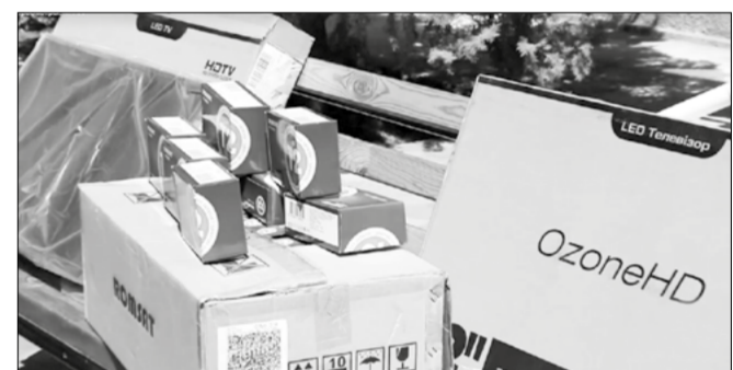
Приставки T2 та сучасні телевізори – військовому шпиталю

Ми запустили ініціативу «Піклуйся про сусідів!» з метою допомоги в період