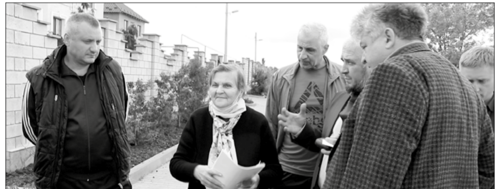
Жители улицы Хуторской совместно с представителями ГО «Таїрове – це ми» и «Народного бюро расследований» на встрече с собственником участка в балке и его адвокатом

Были сделаны десятки обращений в самые разные