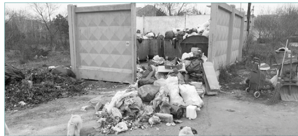
Первый признак неработающего ЖКП – горы мусора. На фото: контейнерная площадка на ул. Центральной в Червоном Хуторе

Подобный перечень можно продолжать до бесконечности. К примеру, детские площадки. Создается впечатление, что нынешняя временная власть озбочена лишь одной целью: как можно быстрее растратить все деньги бюджета до последней копейки, забыв, что это финансы не их, а людей – добросовестных налогоплательщиков. Иначе как расценить тотальное «увлечение» нынешней власти строительством детских площадок где только можно? Удовольствие не дешевое, но эффективное. И так во всем: пару лет назад построили футбольную площадку в «Радужном» – сейчас срочно понадобилась ее капитальный ремонт. Приблизительно тоже самое с подобным спортивным сооружением, но в Таирово.