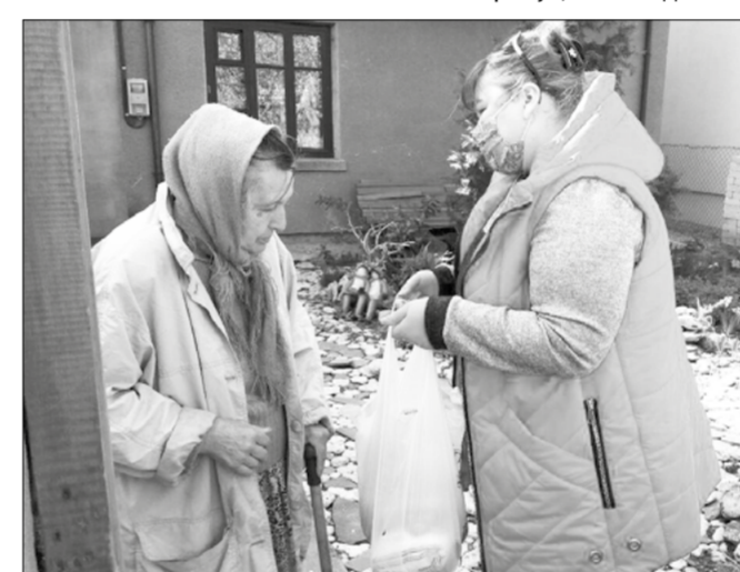
Продуктова допомога літнім людям від «Волонтерів Таїрова»

В наш непростой час багато осіб потребують підтримки та допомоги, тому