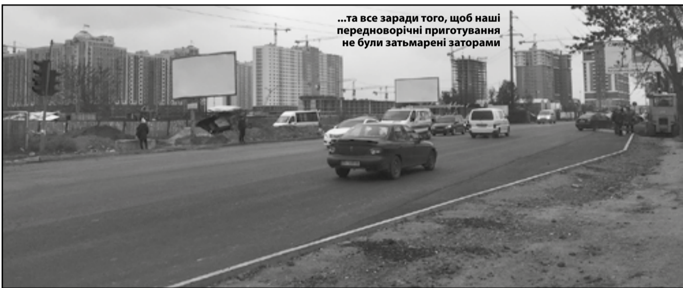
...та все заради того, щоб наші передноворічні приготування не були затьмарені заторами

паркомісця уздовж дороги, встановити бордюри – це буде зроблено швидше за все вже після зими. Але як довго протримається нове асфальтне покриття та чи не з'являться навесні на ньому такі звичні ями?