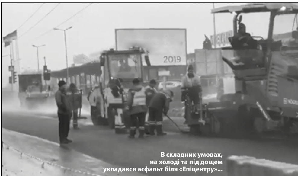
В складних умовах, на холоді та під дощем укладався асфальт біля «Епіцентру»...